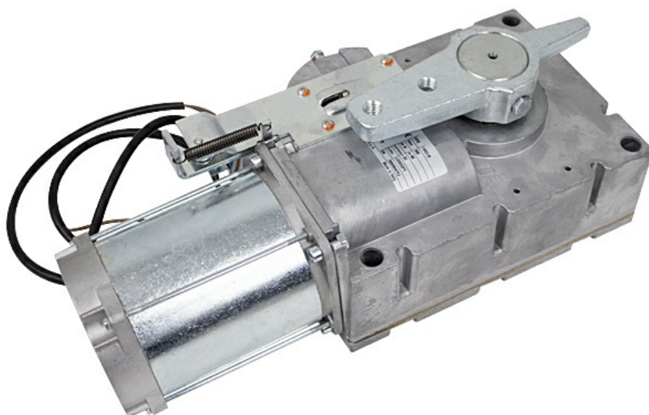
Фото Моторедуктор G6000 G6000I CAME 119RIG195

Отправьте запрос на коммерческое предложение и получите индивидуальные цены и сроки поставки