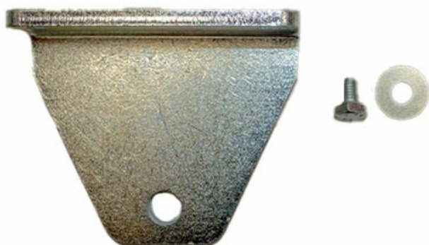
Фото Кронштейн передний OPP001 CAME 119RID424

Отправьте запрос на коммерческое предложение и получите индивидуальные цены и сроки поставки