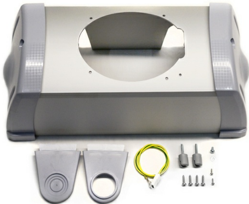
Фото Корпус FE 40230, FE 4024 CAME 119RID360

Отправьте запрос на коммерческое предложение и получите индивидуальные цены и сроки поставки