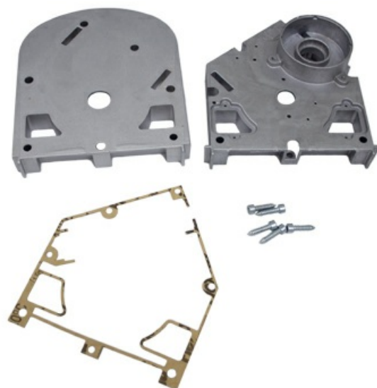
Фото Корпус редуктора FAST CAME 119RID227

Отправьте запрос на коммерческое предложение и получите индивидуальные цены и сроки поставки