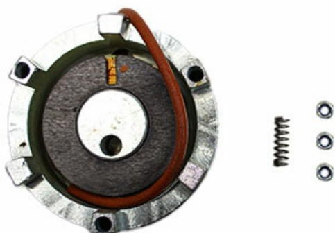
Фото Электромагнит ВХ-Р, ВК-1200Р CAME 119RIBX035

Отправьте запрос на коммерческое предложение и получите индивидуальные цены и сроки поставки