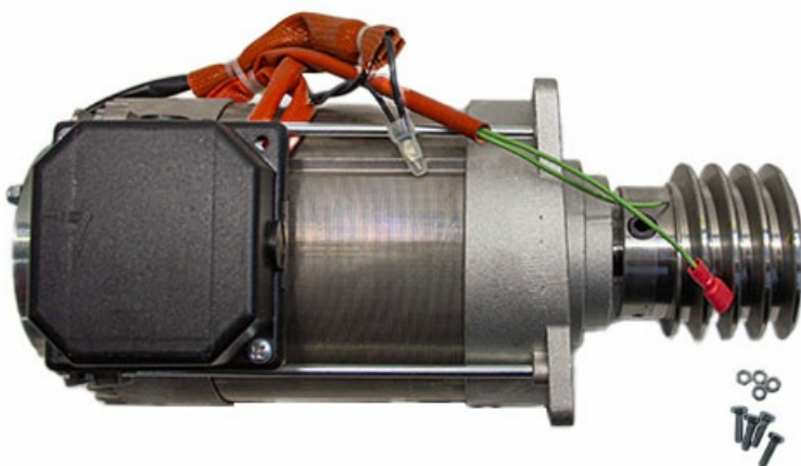
Фото Электродвигатель ВК-2200Т (арт119RIBK034) CAME 119RIBK034

Отправьте запрос на коммерческое предложение и получите индивидуальные цены и сроки поставки