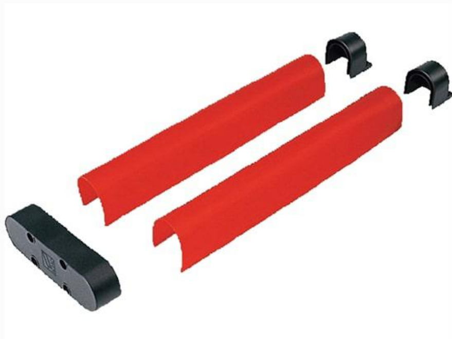
Фото Накладки резиновые на стрелу 001G0601 CAME 009G0603

Отправьте запрос на коммерческое предложение и получите индивидуальные цены и сроки поставки