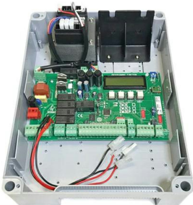
Фото Блок управления многофункциональный для приводов 230 В САМЕ 002М3Е

Отправьте запрос на коммерческое предложение и получите индивидуальные цены и сроки поставки