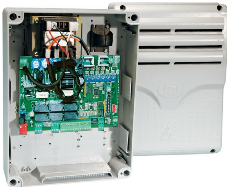
Фото Блок управления с расширенным набором функций CAME 002ZL90

Отправьте запрос на коммерческое предложение и получите индивидуальные цены и сроки поставки