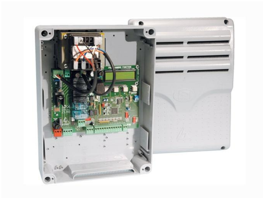
Фото Блок управления для приводов 24 В с энкодером CAME 002ZL80

Отправьте запрос на коммерческое предложение и получите индивидуальные цены и сроки поставки