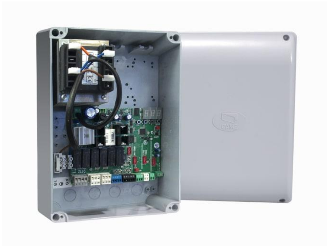
Фото Блок управления с расширенным набором функций CAME 002ZL65

Отправьте запрос на коммерческое предложение и получите индивидуальные цены и сроки поставки