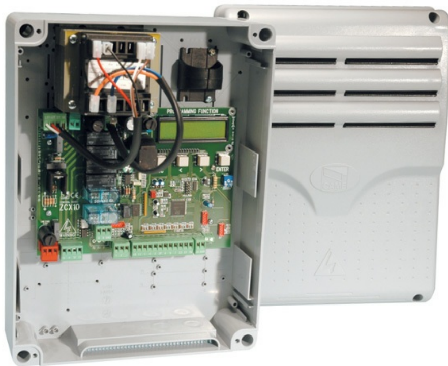
Фото Блок управления с расширенным набором функций CAME 002ZL19N

Отправьте запрос на коммерческое предложение и получите индивидуальные цены и сроки поставки