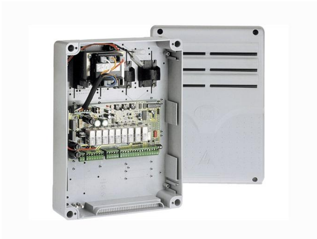
Фото Блок управления ZC3 CAME 002ZC3

Отправьте запрос на коммерческое предложение и получите индивидуальные цены и сроки поставки