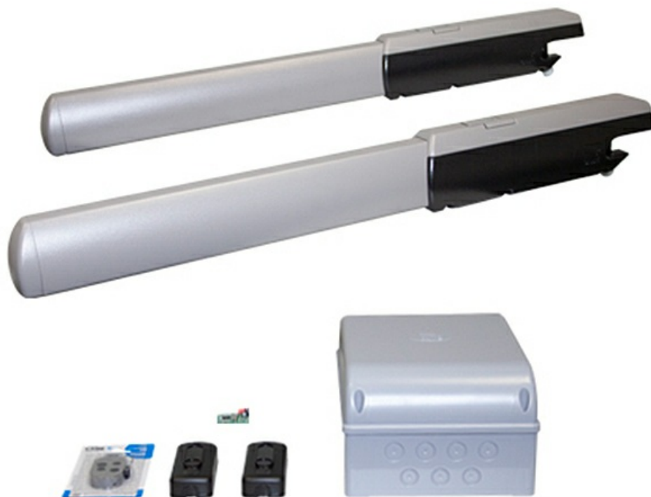
Фото Комплект АТІ5000 CAME 001U1520RU

Отправьте запрос на коммерческое предложение и получите индивидуальные цены и сроки поставки