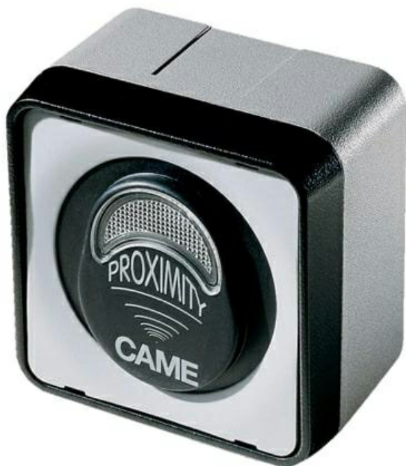
Фото Накладной проксимити-считыватель для карт Em-Marine PROXIMITY CAME 001TSP01

Отправьте запрос на коммерческое предложение и получите индивидуальные цены и сроки поставки