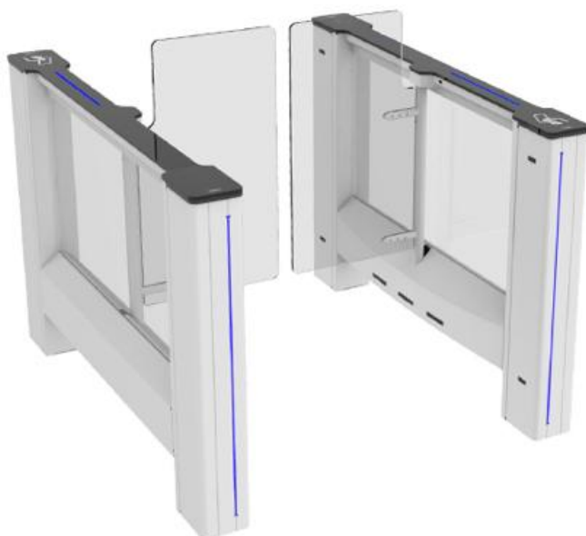
Фото Комплект распашного турникета SWING GATE SWG90 CAME 001SWG90M

Отправьте запрос на коммерческое предложение и получите индивидуальные цены и сроки поставки