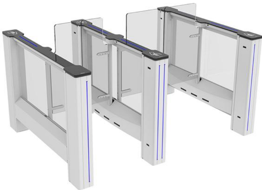
Фото Турникет с распашными створками двухпроходный SWING GATE SWG90M комбинированный, ширина прохода 550 + 900 мм CAME 001SWG5590M

Отправьте запрос на коммерческое предложение и получите индивидуальные цены и сроки поставки