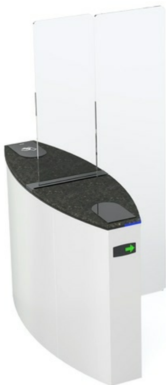
Фото Боковой модуль раздвижного турникета SLIDING GATE SG90T, ширина прохода 900 мм, (левый или правый) CAME 001SG90TS

Отправьте запрос на коммерческое предложение и получите индивидуальные цены и сроки поставки