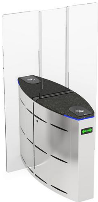
Фото Центральный модуль раздвижного турникета SLIDING GATE SG90T, ширина прохода 2 x 900 мм CAME 001SG90TC

Отправьте запрос на коммерческое предложение и получите индивидуальные цены и сроки поставки