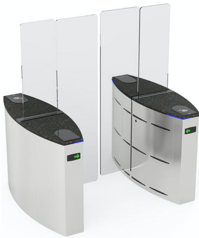
Фото Турникет с раздвижными створками SLIDING GATE SG90T CAME 001SG90T

Отправьте запрос на коммерческое предложение и получите индивидуальные цены и сроки поставки