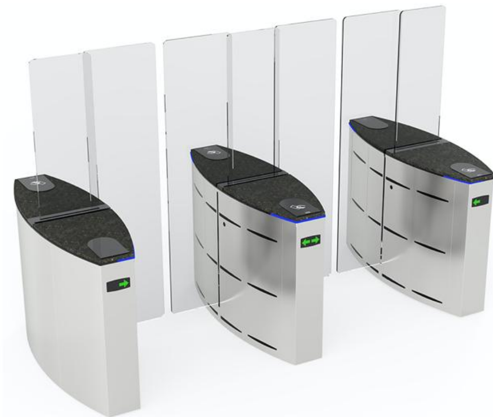
Фото Турникет с раздвижными створками SLIDING GATE SG90T, ширина прохода 2 x 900 мм CAME 001SG90T-DBL

Отправьте запрос на коммерческое предложение и получите индивидуальные цены и сроки поставки