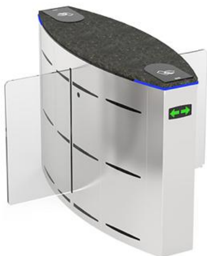
Фото Центральный модуль раздвижного турникета SLIDING GATE SG90S CAME 001SG90SC

Отправьте запрос на коммерческое предложение и получите индивидуальные цены и сроки поставки