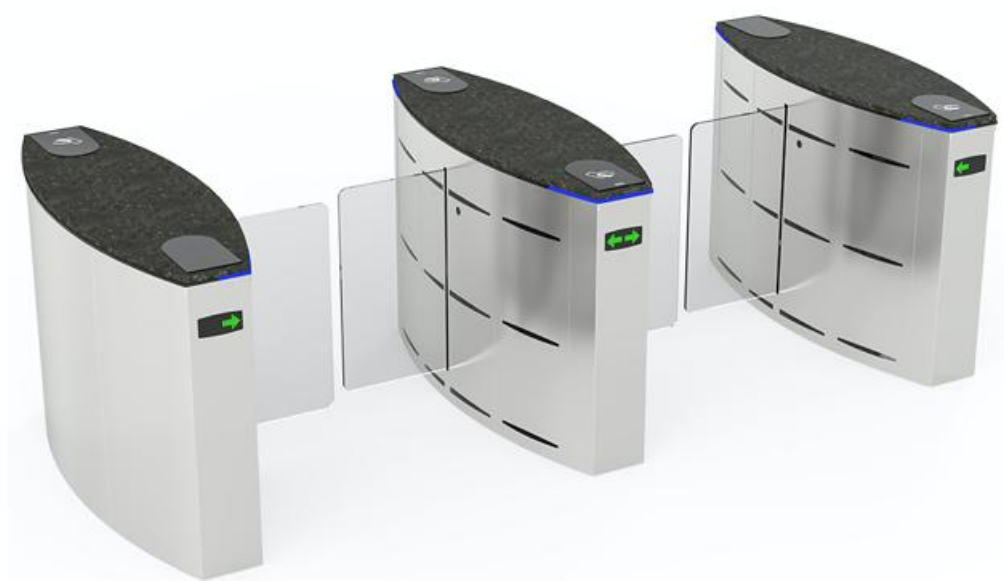
Фото Турникет с раздвижными створками SLIDING GATE SG90S двухпроходный CAME 001SG90S-DBL

Отправьте запрос на коммерческое предложение и получите индивидуальные цены и сроки поставки