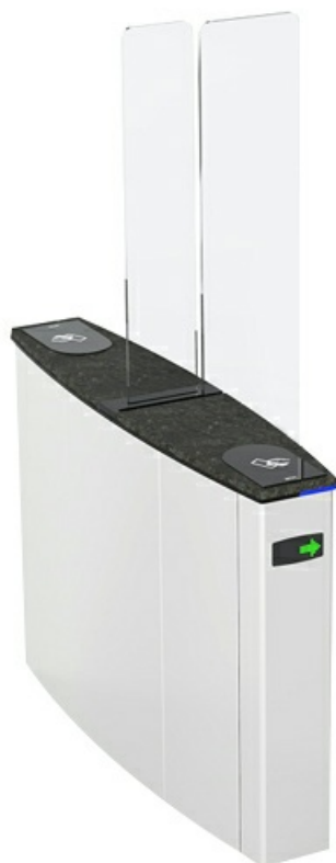
Фото Боковой модуль раздвижного турникета SLIDING GATE SG55T, ширина прохода 550 мм, (левый или правый) CAME 001SG55TS

Отправьте запрос на коммерческое предложение и получите индивидуальные цены и сроки поставки