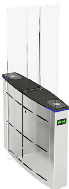
Фото Центральный модуль раздвижного турникета SLIDING GATE SG55M ширина прохода 2 x 550 мм CAME 001SG55TC

Отправьте запрос на коммерческое предложение и получите индивидуальные цены и сроки поставки