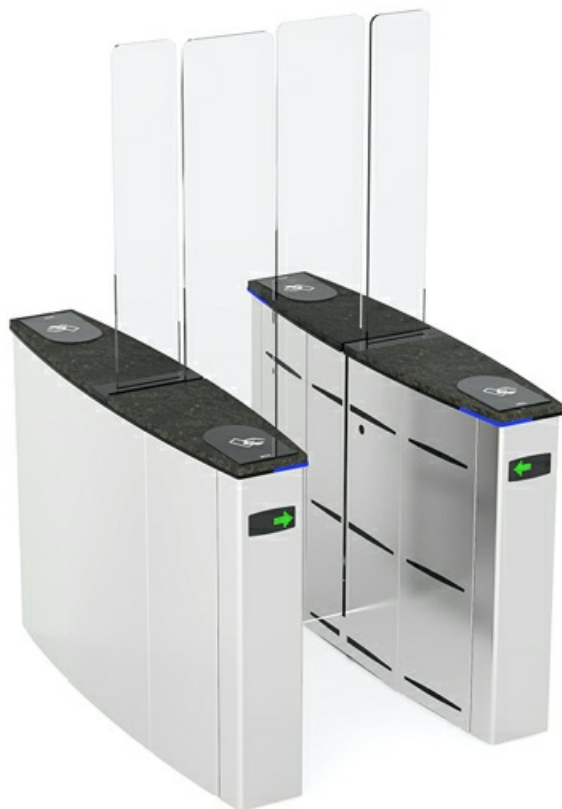
Фото SLIDING GATE SG55 турникет с раздвижными створками CAME 001SG55T

Отправьте запрос на коммерческое предложение и получите индивидуальные цены и сроки поставки