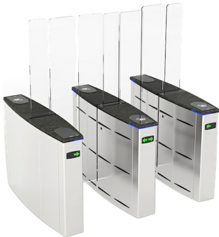
Фото Раздвижной турникет SLIDING GATE SG55 CAME 001SG55T-DBL

Отправьте запрос на коммерческое предложение и получите индивидуальные цены и сроки поставки