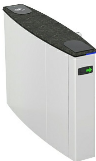
Фото Боковой модуль раздвижного турникета SLIDING GATE SG55S, ширина прохода 550 мм, (левый или правый) CAME 001SG55SS

Отправьте запрос на коммерческое предложение и получите индивидуальные цены и сроки поставки