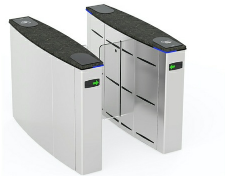
Фото Турникет с раздвижными створками SLIDING GATE SG55S CAME 001SG55S

Отправьте запрос на коммерческое предложение и получите индивидуальные цены и сроки поставки