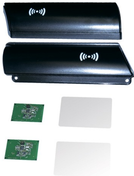
Фото Колонна для отдельной установки мультисчитывателя X VIA CAME 001PSXVA3

Отправьте запрос на коммерческое предложение и получите индивидуальные цены и сроки поставки