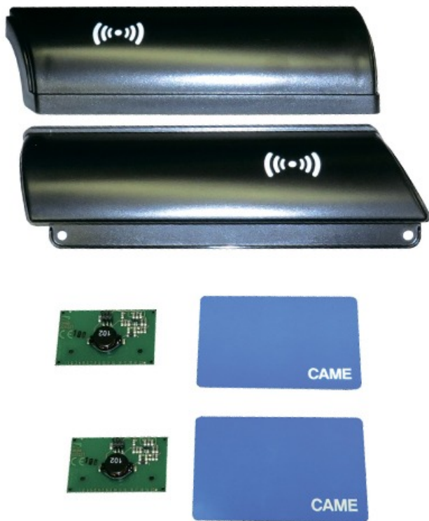
Фото Комплект установочный для мультисчитывателя XVIA на турникет CAME 001PSXVA2

Отправьте запрос на коммерческое предложение и получите индивидуальные цены и сроки поставки