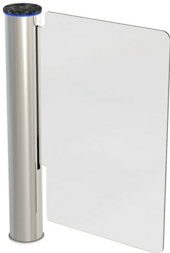
Фото Турникет-калитка полноростовая моторизованная WING GL со створкой из закаленного стекла 900 мм CAME 001PSWNG4GLA2

Отправьте запрос на коммерческое предложение и получите индивидуальные цены и сроки поставки