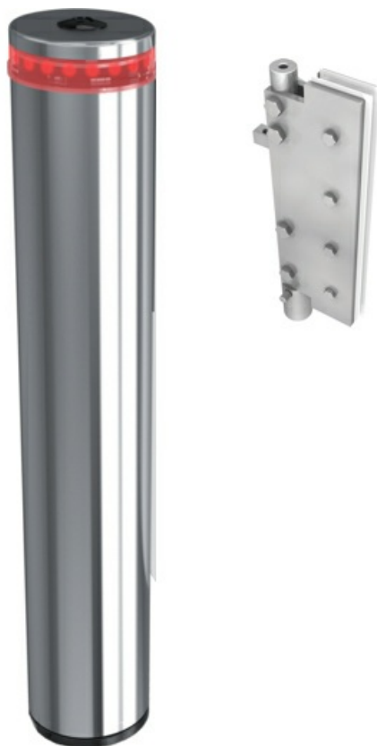
Фото Турникет-калитка моторизованная WING 40 CAME 001PSWNG40-CUSTOM

Отправьте запрос на коммерческое предложение и получите индивидуальные цены и сроки поставки