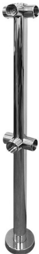
Фото Стойка с крепежным фланцем и накладкой, 6 отверстий CAME 001PSTRVX6F

Отправьте запрос на коммерческое предложение и получите индивидуальные цены и сроки поставки