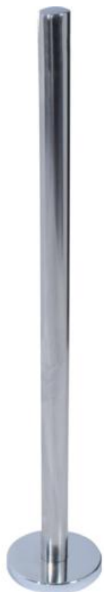
Фото Стойка с крепежным фланцем и накладкой, без отверстий CAME 001PSTRVX

Отправьте запрос на коммерческое предложение и получите индивидуальные цены и сроки поставки