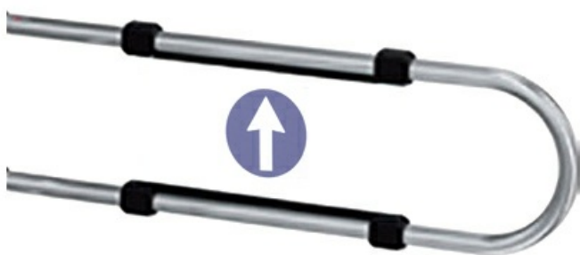
Фото Створка поворотная механическая, ширина прохода 1200 мм CAME 001PSTRT120A

Отправьте запрос на коммерческое предложение и получите индивидуальные цены и сроки поставки