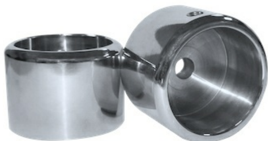
Фото Соединительные муфты (пара) CAME 001PSTRM004

Отправьте запрос на коммерческое предложение и получите индивидуальные цены и сроки поставки