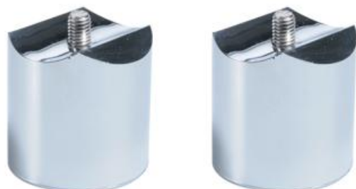
Фото Соединительные муфты (пара) CAME 001PSTRM003

Отправьте запрос на коммерческое предложение и получите индивидуальные цены и сроки поставки