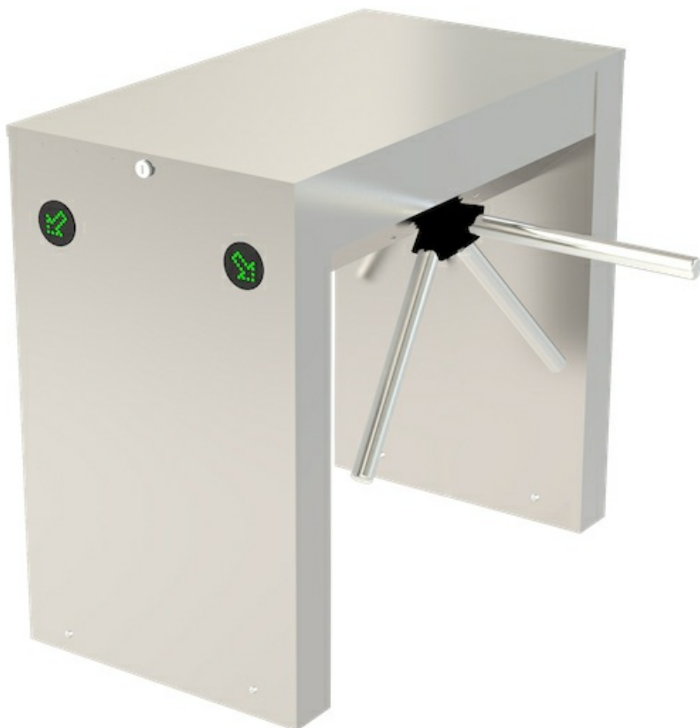
Фото Тумбовый моторизованный турникет TWISTER 700 сдвоенный CAME 001PST700END-01

Отправьте запрос на коммерческое предложение и получите индивидуальные цены и сроки поставки