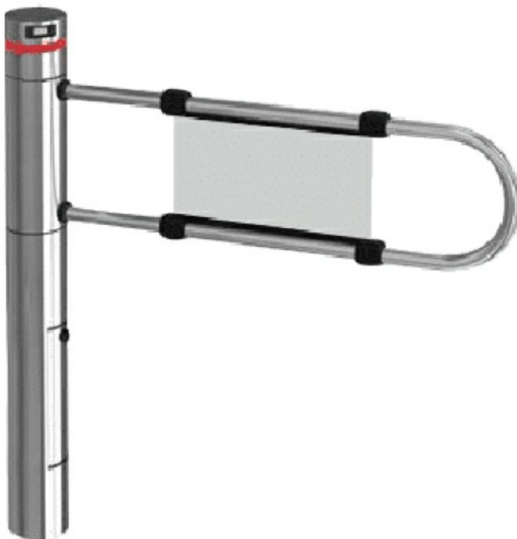
Фото Турникет-калитка моторизованная SALOON 40 со створкой 900 мм CAME 001PSSLN40-900

Отправьте запрос на коммерческое предложение и получите индивидуальные цены и сроки поставки