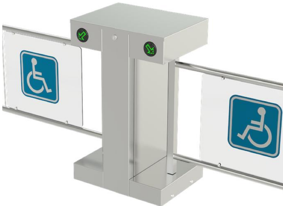
Фото Турникет-калитка МГН моторизованная SALOON 705 двухпроходная CAME 001PSSL705END

Отправьте запрос на коммерческое предложение и получите индивидуальные цены и сроки поставки