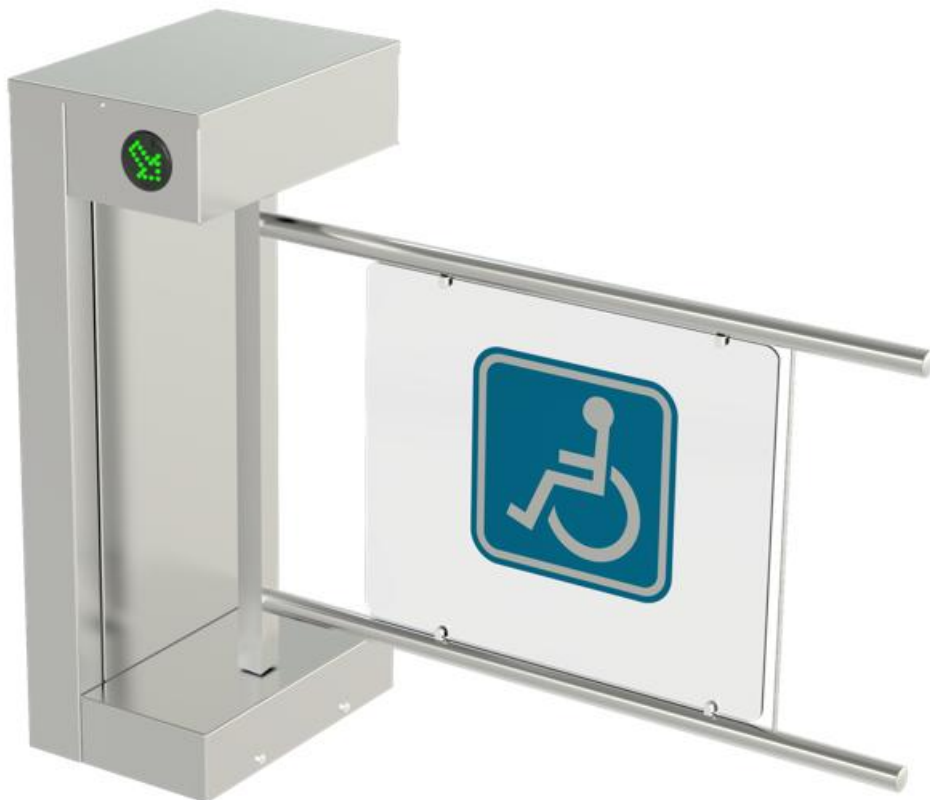
Фото Турникет-калитка МГН моторизованная SALOON 705 CAME 001PSSL705EN

Отправьте запрос на коммерческое предложение и получите индивидуальные цены и сроки поставки