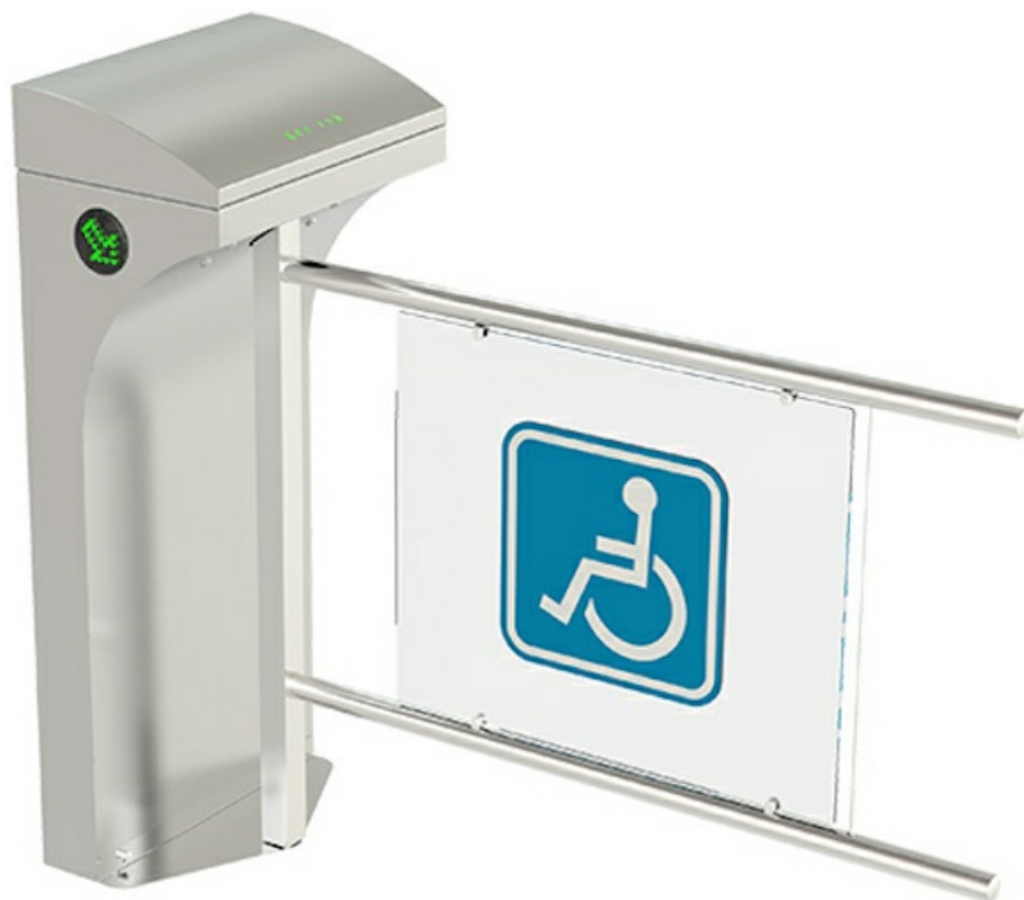
Фото Турникет-калитка МГН моторизованная SALOON 605 CAME 001PSSL605S

Отправьте запрос на коммерческое предложение и получите индивидуальные цены и сроки поставки