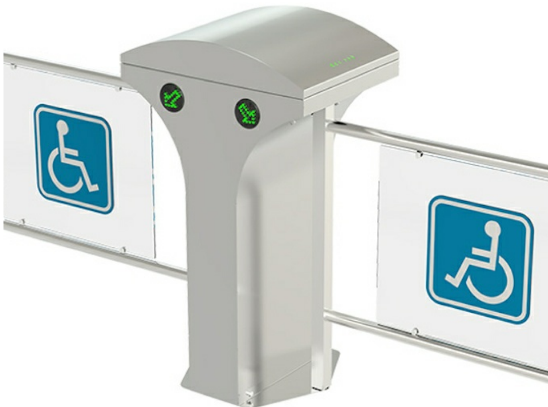
Фото Турникет-калитка МГН моторизованная двухпроходная SALOON 605 CAME 001PSSL605D

Отправьте запрос на коммерческое предложение и получите индивидуальные цены и сроки поставки