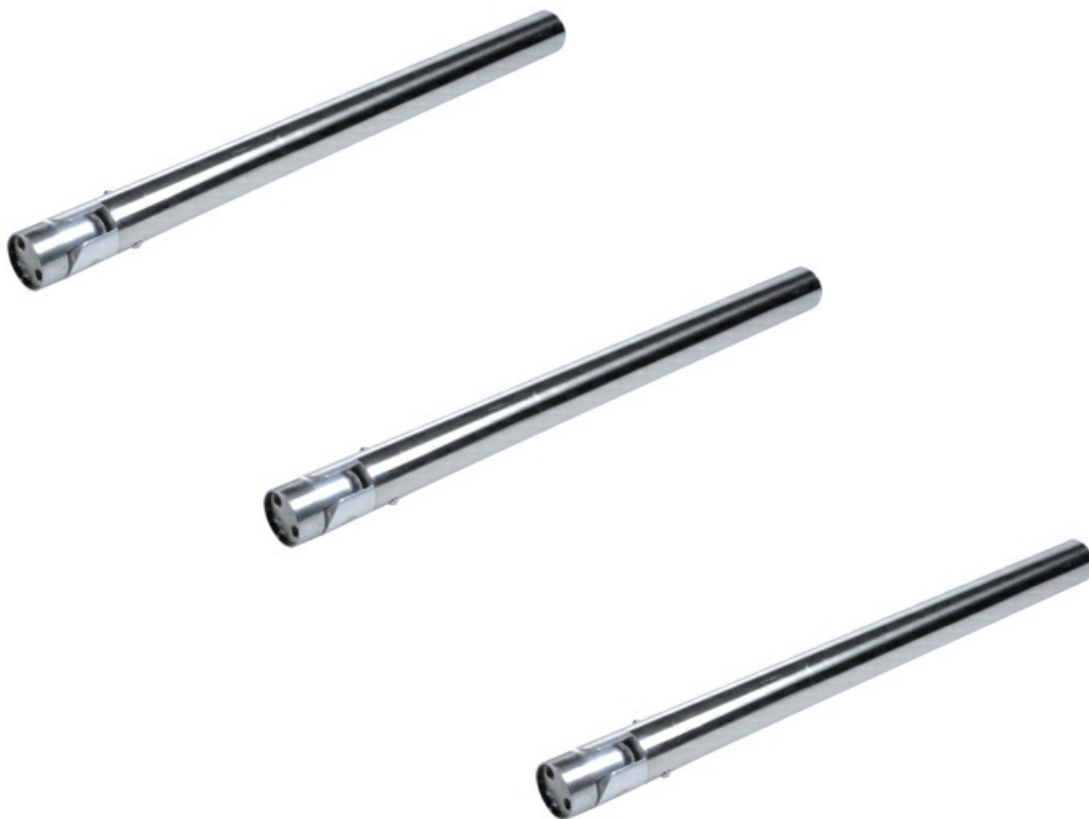
Фото Блок шарнирных створок антипаника для турникетов TWISTER CAME 001PSOPSC01

Отправьте запрос на коммерческое предложение и получите индивидуальные цены и сроки поставки