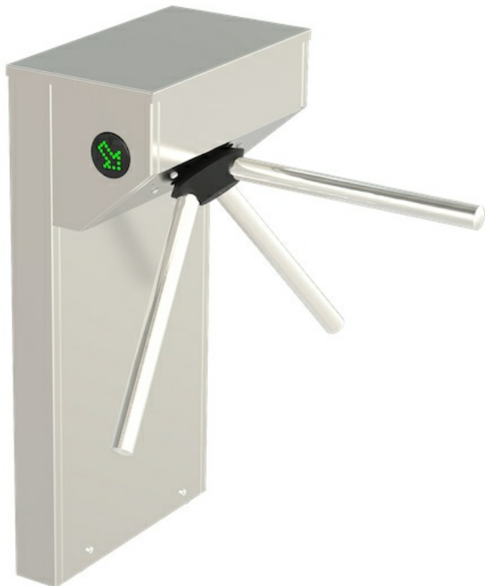
Фото Турникет-трипод моторизованный STILE 500 CAME 001PSMM500E-01

Отправьте запрос на коммерческое предложение и получите индивидуальные цены и сроки поставки