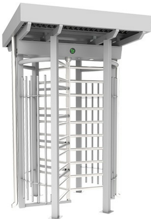
Фото Турникет полноростовый моторизованный GUARDIAN BTX 300 S ROOF CAME 001PSGS3BROOF

Отправьте запрос на коммерческое предложение и получите индивидуальные цены и сроки поставки