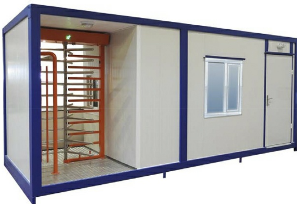
Фото Мобильный бокс CAME CONTAINER 6M В CAME 001PSGC6MB

Отправьте запрос на коммерческое предложение и получите индивидуальные цены и сроки поставки