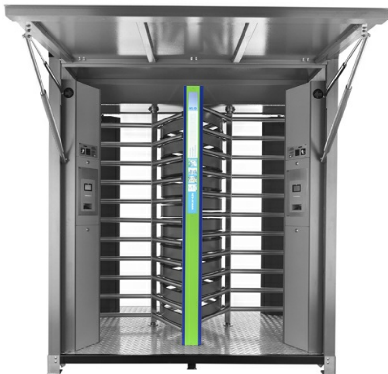
Фото Центральная информационная панель CAME 001PSGC-ADV

Отправьте запрос на коммерческое предложение и получите индивидуальные цены и сроки поставки