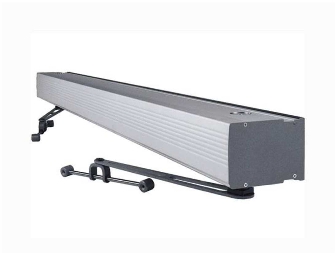
Фото Автоматика для двустворчатых распашных дверей CAME PB2100 001PB2100

Отправьте запрос на коммерческое предложение и получите индивидуальные цены и сроки поставки